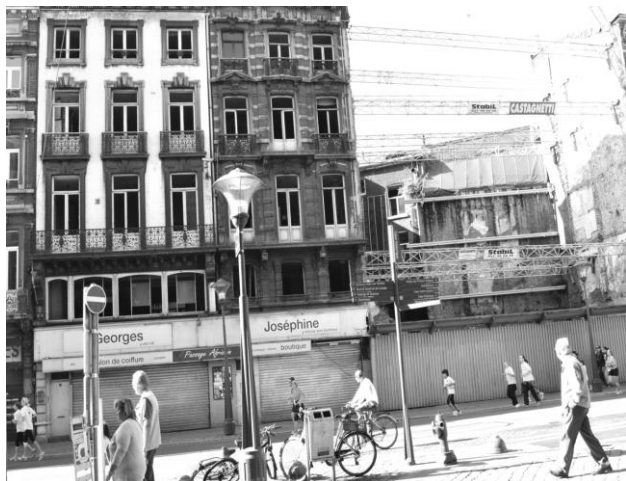
Situation suite à l'explosion de 2010