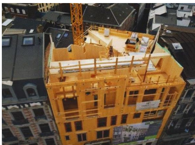
Le montage de l'ossature bois.

Une construction inédite comble le vide laissé par l'explosion et l'effondrement de 2 immeubles rue Léopold, une rue liégeoise d'aspect très Haussmannien. Le nouveau bâtiment, de 5 étages et un rez-de-chaussée, est construit presque entièrement en bois, comme vous le voyez ci-dessus.