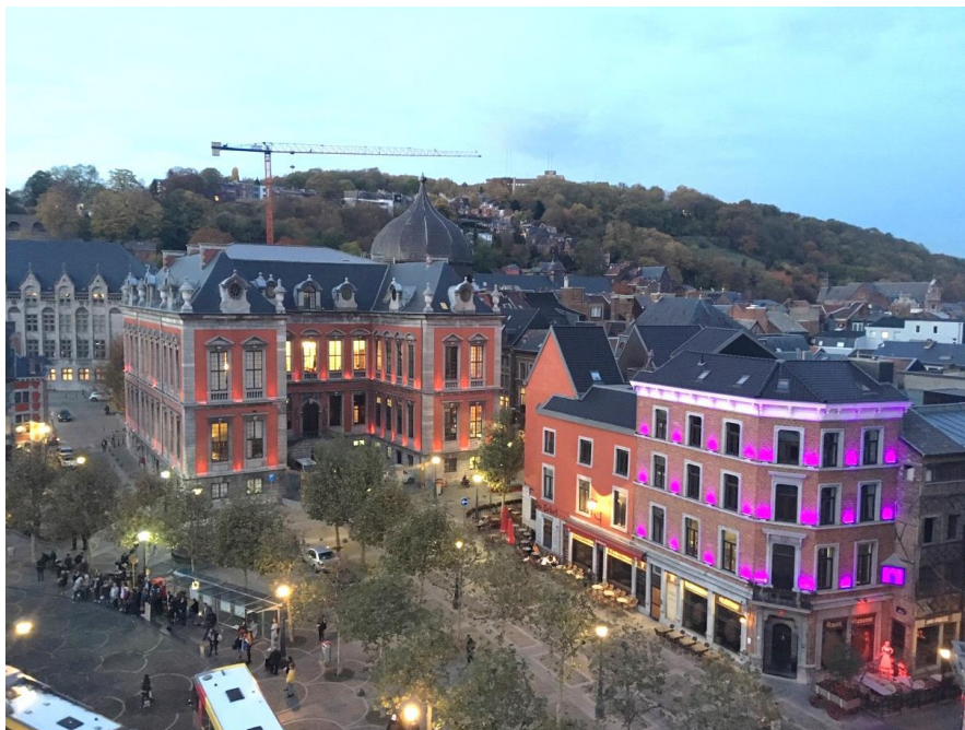
Georges Foulon et les photographes

Pour finir, une vue surprenante. Une photo de la ville en soirée prise du roof-top.