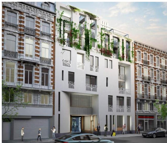
La reconstruction en 2018