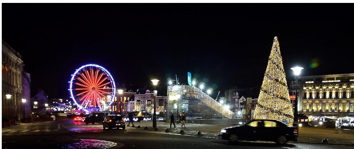
Liège, décembre 2018

Dans l'attente de vous revoir, le comité directeur vous souhaite une année pleine de promesses et succès.