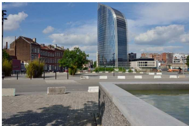
La percée, à venir, vers "la Belle Liégeoise" Les abords de la Tour des Finances, à aménager