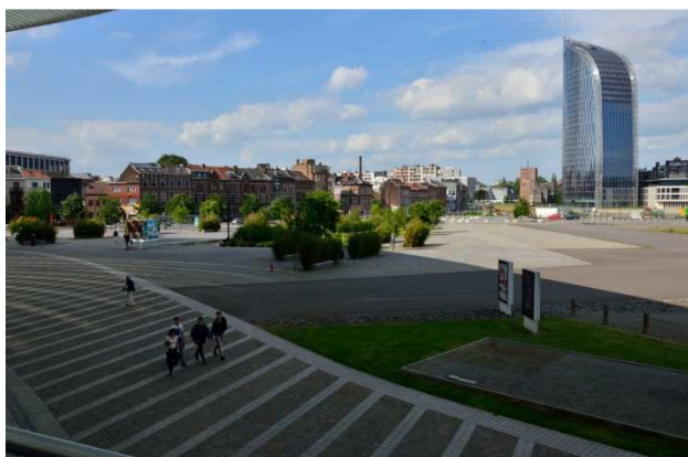
L'espace à construire entre la gare et la Tour des Finances

Architectes: Dethier Architecture, Ney & Partners, Atelier 4D