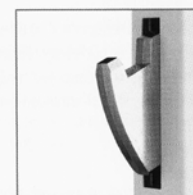
Système de sécurisation