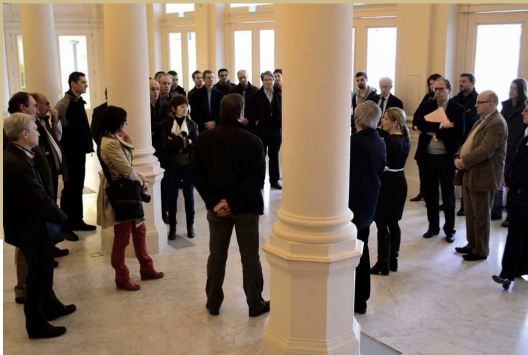
Réunion dans le hall de l'Opéra Royal de Wallonie, une importante délégation de l'ARALg s'apprête à visiter le théâtre rénové.